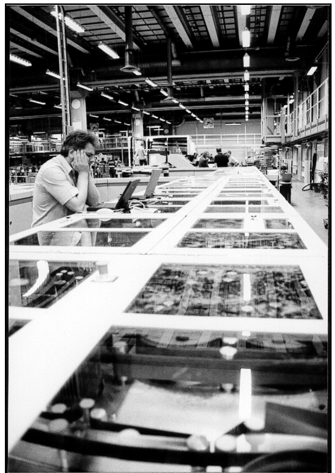
En bekymrad tekniker. Här vid BRM:en på Tomtebodan.

År 1999 spikades nedläggningen av den allra sista serviceterminalen - Visby. IRM-maskiner installerades till ett värde av en kvarts miljard och började glufsa i sig volymer och försändelser. Maskineringen av Riksnätets arbetskedja tog därmed ytterliga-