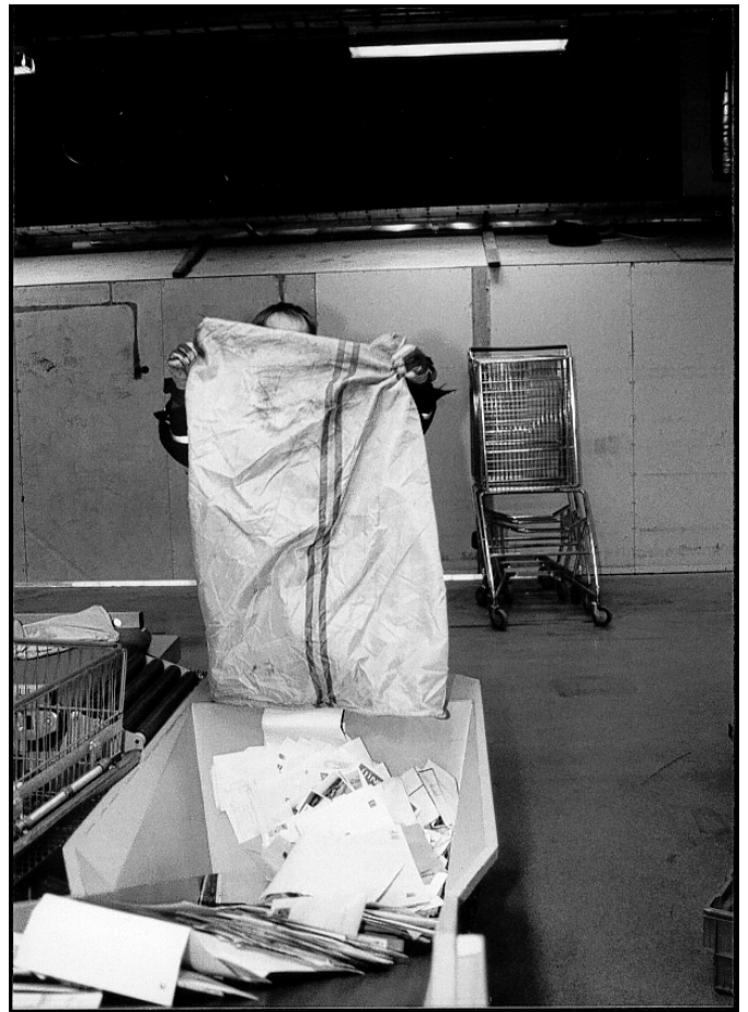
Brevresningen på Årsta. Bakom säcken....

Lönerevisionen inom Terminal Stockholm avslutades den 9 juni. Det innebär att vi för första gången på mycket länge fick de nya lönerna utbetalda samma månad som de började gälla!