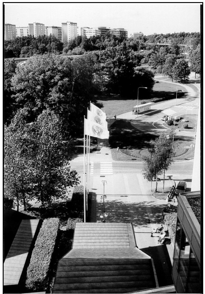
En solig brittsommardag kom beskedet: Stockholmsterminalerna delas och Tomtebodas får ny chef!

När det gäller möjligheten att få ersättning för förlorad arbetsförtjänst försvann detta 1998 och trots att vi har uppvakat ett antal politiker sedan dess så står beslutet fast. Detta har i mångt och mycket försvårat för våra medlemmar att få en personlig