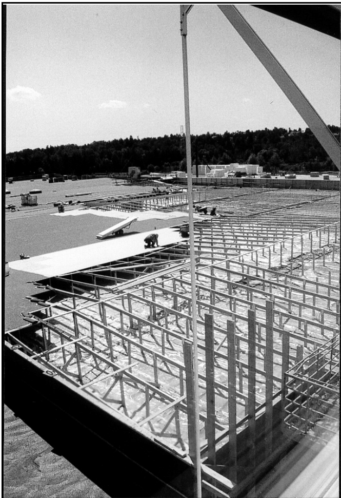
Mycket av klubbens arbete det senaste året har handlat om Sth Syd. Här en snickare på taket, lyckligt ovetande om alla gräl kring den nya terminalen.

Glädjande nog finns det bland oss alltid duktiga kamrater i våra kretsar som är villiga att axla ansvar och ta fackliga förtroen-