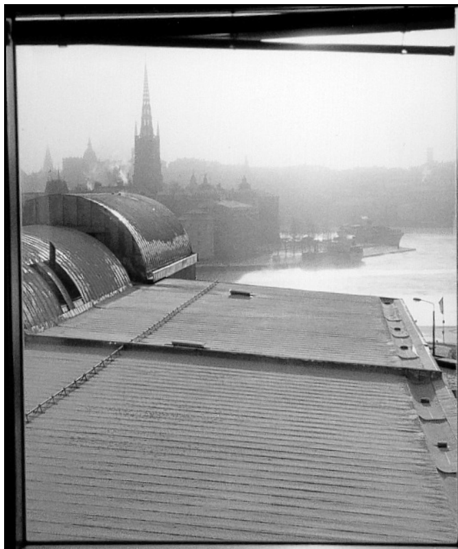
En av landets vackraste utsikter blev för dyr för vanligt folk. Sorterarna åker ut, och in kommer konferensvärldens jetset.

Den fackliga organisationen har inte samma resurser till förfogande som arbetsgivaren och kravet på att snabbt ta ställning till föreslagna beslut har därmed medfört att den fackliga förankringen hos medlemmarna, i viss mån, blivit lidande. Ett fenomen som vi tillsammans måste fundera över och hitta lösningar på.