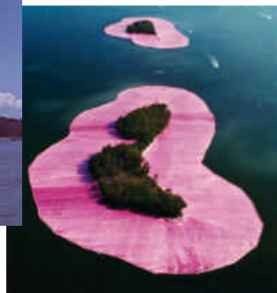
Christo and Jeanne-Claude: Surrounded Islands, Biscayne Bay, Greater Miami, Florida, 1980-83