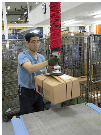
En av Vaculexarna i drift.