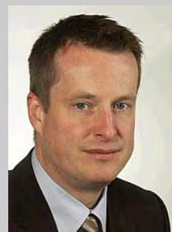
Anders Ygeman (S)