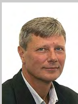
Lars Ohly (V)

Torsdagen den 14 september 17.30 - 18.30