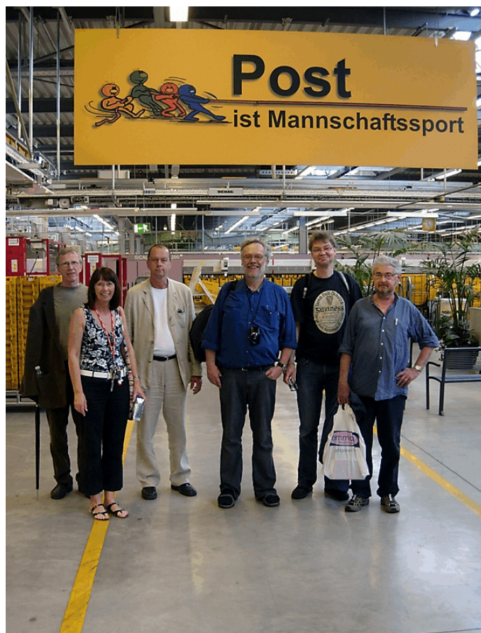
"Post är lagarbete"

Några brevbärare och en terminalare från Stockholm besökte brevbäringen och terminalen i Berlin. Läs deras reportage inne i tidningen!