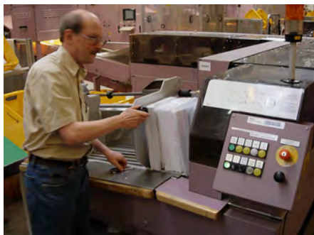
Ovan: Storbrevsinmatningen. Ingen operatörsskärm här heller!