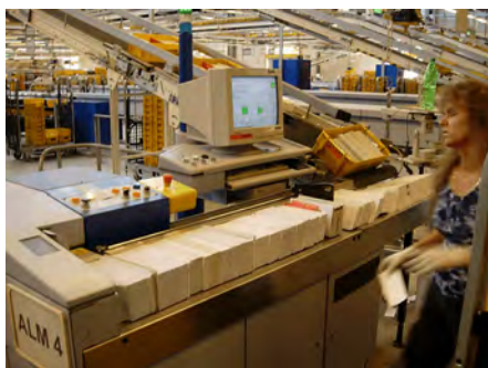
Nedan: GSM-inmatningen. Notera LTP in.

blem vid sjukdom, då ju dessa brukade användas som reserver i brevbäringen.