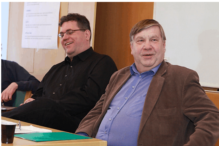
Sektion Ledare & specialisters årsmöte.