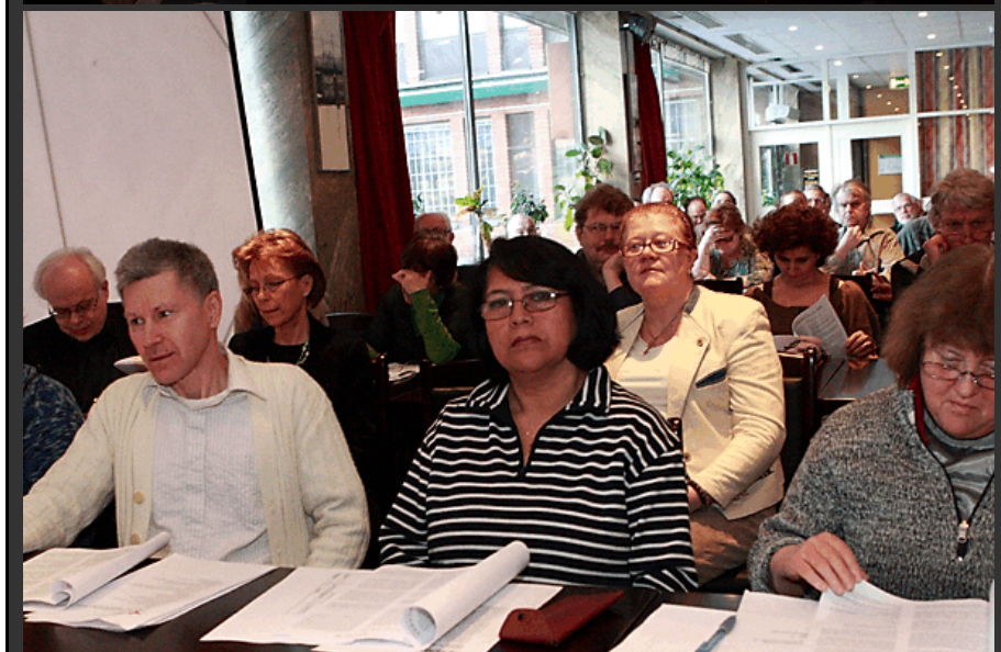
Från Årsta Sektion Natts årsmöte.

Faktuellt - ledande postfacklig tidning.