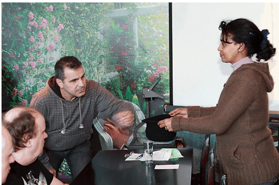
Från Sektion DKV:s årsmöte.