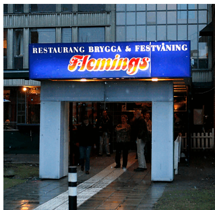
Restaurang Fleming - populär åmötess-lokal.

ka synpunkter på fusionen med danskarna. På övriga frågor togs bland annat den – bokstavliga – utfrysningen av rökarna upp, önskvärdheten av en Rosersbergsterminal eller ej, vilka regler gäller för förstadagsintyg, den uteblivna ledarutvärderingen.