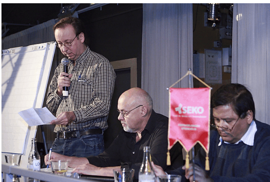
Från Sektion 1-2:s årsmöte 14 februari.

Styrelsen fick sin verksamhetsberättelse godkänd och mötet följde revisorernas uppmaning att bevilja styrelsen ansvarsfrihet för det gångna årets verksamhet.