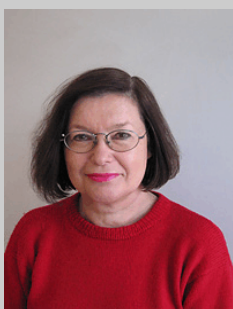
Railii Kalliovaara Ledamot Kultur