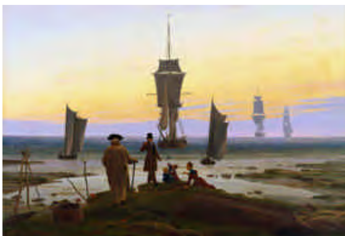
Caspar David Friedrich Livsälldrarna, ca 1834