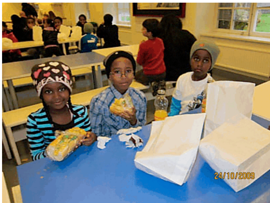
Cosmonovabesöket 24 oktober.

Efter augusti och september månadernas föreställningar i Dramaten är vi ute nu på andra periodens biljetter: "Muntra Fruarna i Windsor" och "Höstsonaten" på stora scenen Nybroplan.