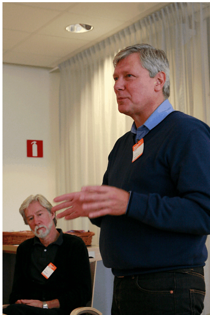
Valrörelsen har börjat. Lars Ohly höll ett inspirerande anförande vid Årstaklubbens sektionkonferens den 29 oktober.