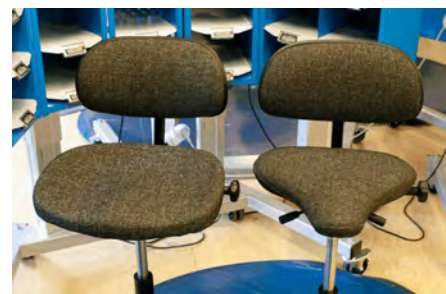
Traktorsadel och cykelsadel!

– Fram till dess rekommenderar vi att man arbetar stående eller använder en