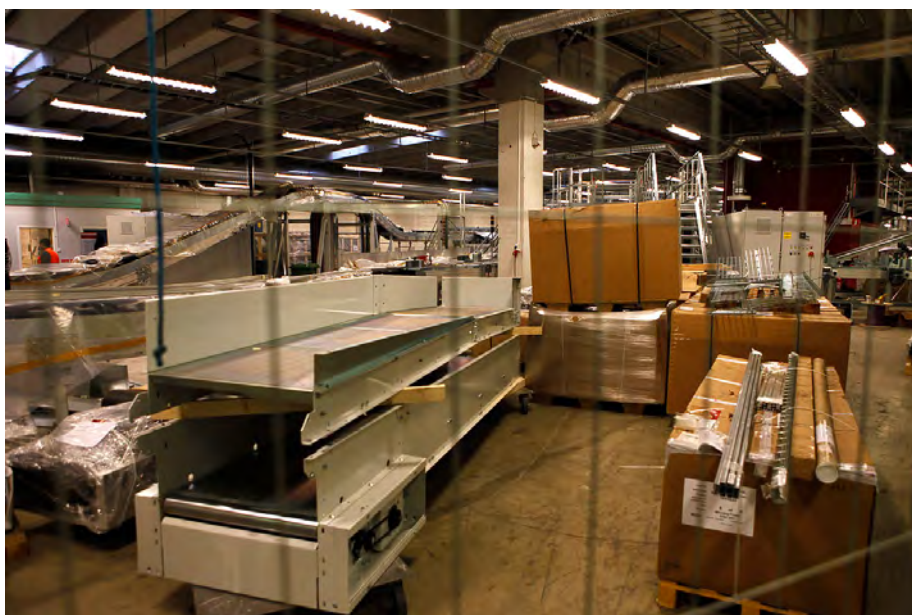
KSM-piloten på Årsta, den 4 april kl. 08,41.

Slutbudet (?) från förbättringsgrupperna är att brev-vif:arna flyttas in i manuella storbrevssorteringen utan att några rum i anslutning därtill behöver rivas. De två klumpvif:arna flyttas till SSM-området. Förslaghet innebär att fyra storbrevsfack tas bort och ö-sorterinegn flyttas till området närmast ytterväggen mellan små- och storbrevssorteringen. Förslaget ska bland annat riskanalyseras för att till slut, troligen i maj, föreläggas Årstasamverkan.