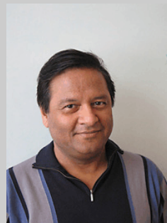
Mohibul Ezdanikhan Ledamot Jämställdhet