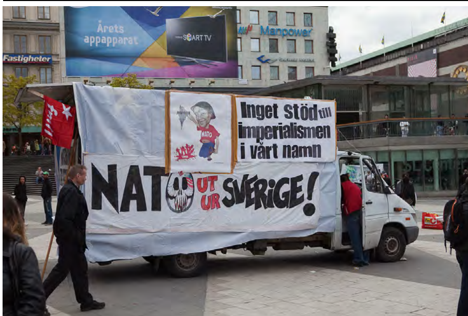
1:a maj 2011 i Stockholm.

Kanske ger oss Olof Palme en del av lösningen. Olof Palmes medarbetare diplomaten Jan Eliasson har givit en livfull beskrivning över hur Olof Palme genomförde för-