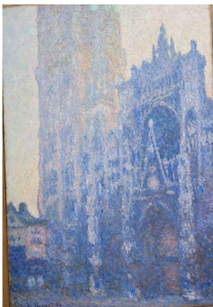
Claude Monet: Katedralen i Rouen