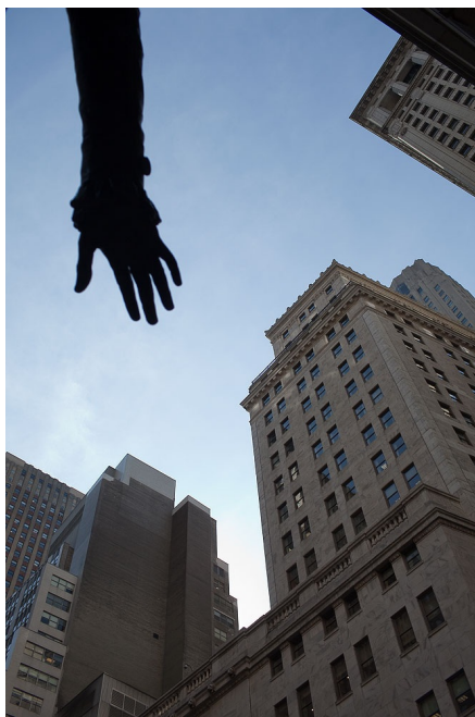
George Washington håller, liksom alla presidenter efter honom, sin skyddande hand över New York Stock Exchange.

att den nya danska postlagen innebär att alla villor från 2012 måste ha en postlåda vid närmaste allmän väg eller gata. Villor byggda 1973 eller senare har redan den skyldigheten, men nu omfattas även äldre hus. Om man inte följer detta kan det resultera i inte enbart att man blir utan post; det kan även bli böter och till och med fängelse!