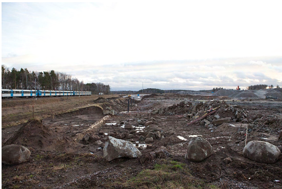
Rosersberg den 10 december. Postens tomt sedd från norr.