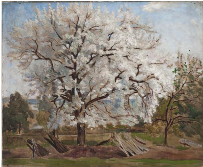
Blommande äppelträd, 1877