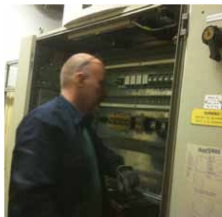
"teknikchefen färdig strömmen till ALA/ALO"

Klubb 631 brev Tomteboda Solna, 29 okt 2013