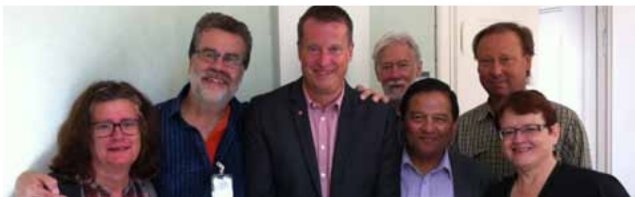
Klubbstyrelsen besöker trafikuskottet och pratar om nedskärningarna på Årsta

Klubben ska alltid förklara, försvara och utveckla kollektivavtalets värde. Vårt mål är att hjälpa våra medlemmar när det behövs, och vara en kunnig och duglig motpart till Arbetsgivaren. Vi ska vara det självklara valet av fackförening på Årsta.