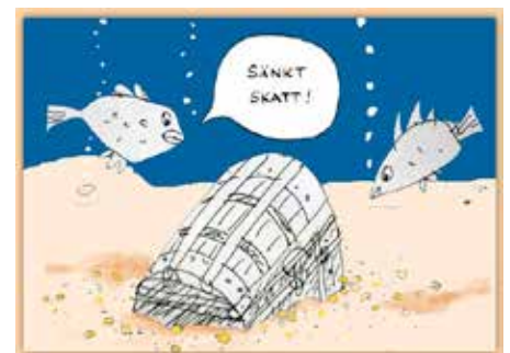
Illustration: Robert Nyberg