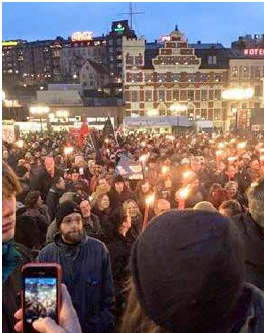
Fackeltåget gör sig redo för avmarsch mot Medborgarplatsen.