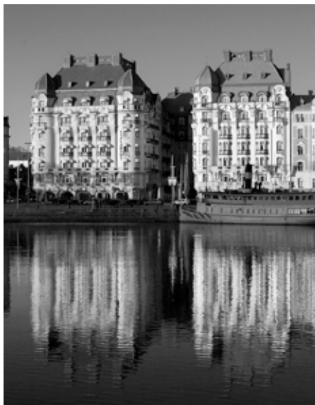
Också ett problemområde: Strandvägen i Stockholm.

alla" ordnade en "Överklassafari" till Solsidan. Där bor bara rika människor. Vilka hus och båtar de äger! De rika upprördes över safarin. Men när journalister skriver och endast nämner det som är negativt i de fattiga förorterna då är det OK