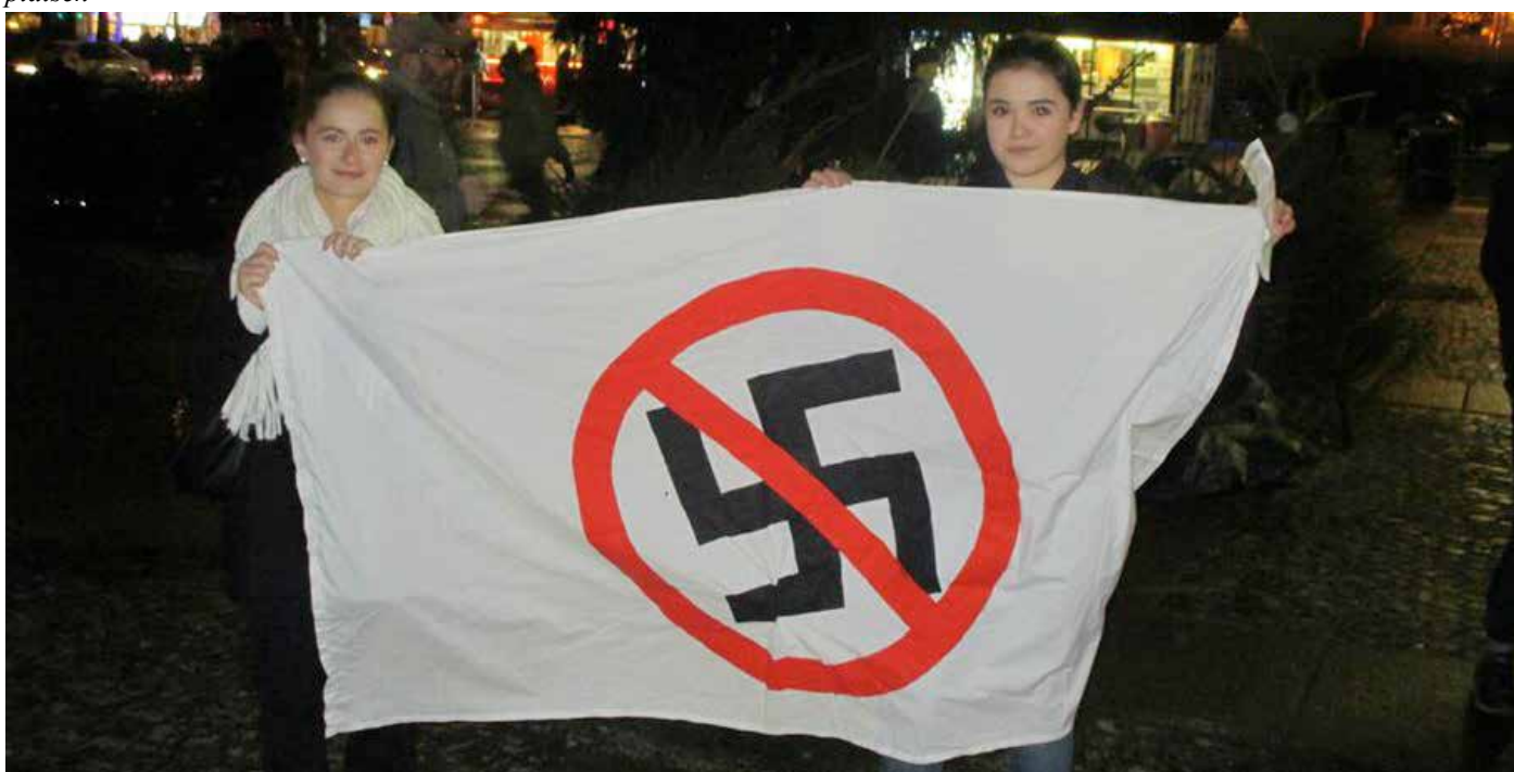
Två av många antirasister