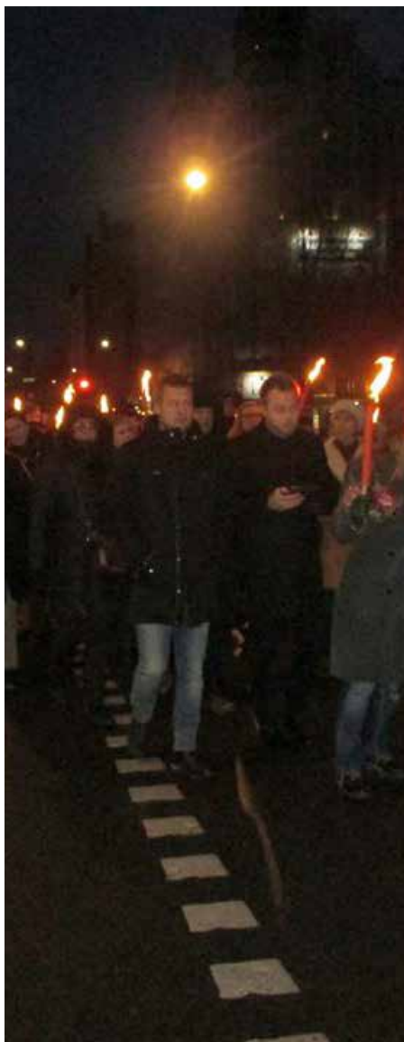
Demonstranterna tågar mot Medborgarplatsen