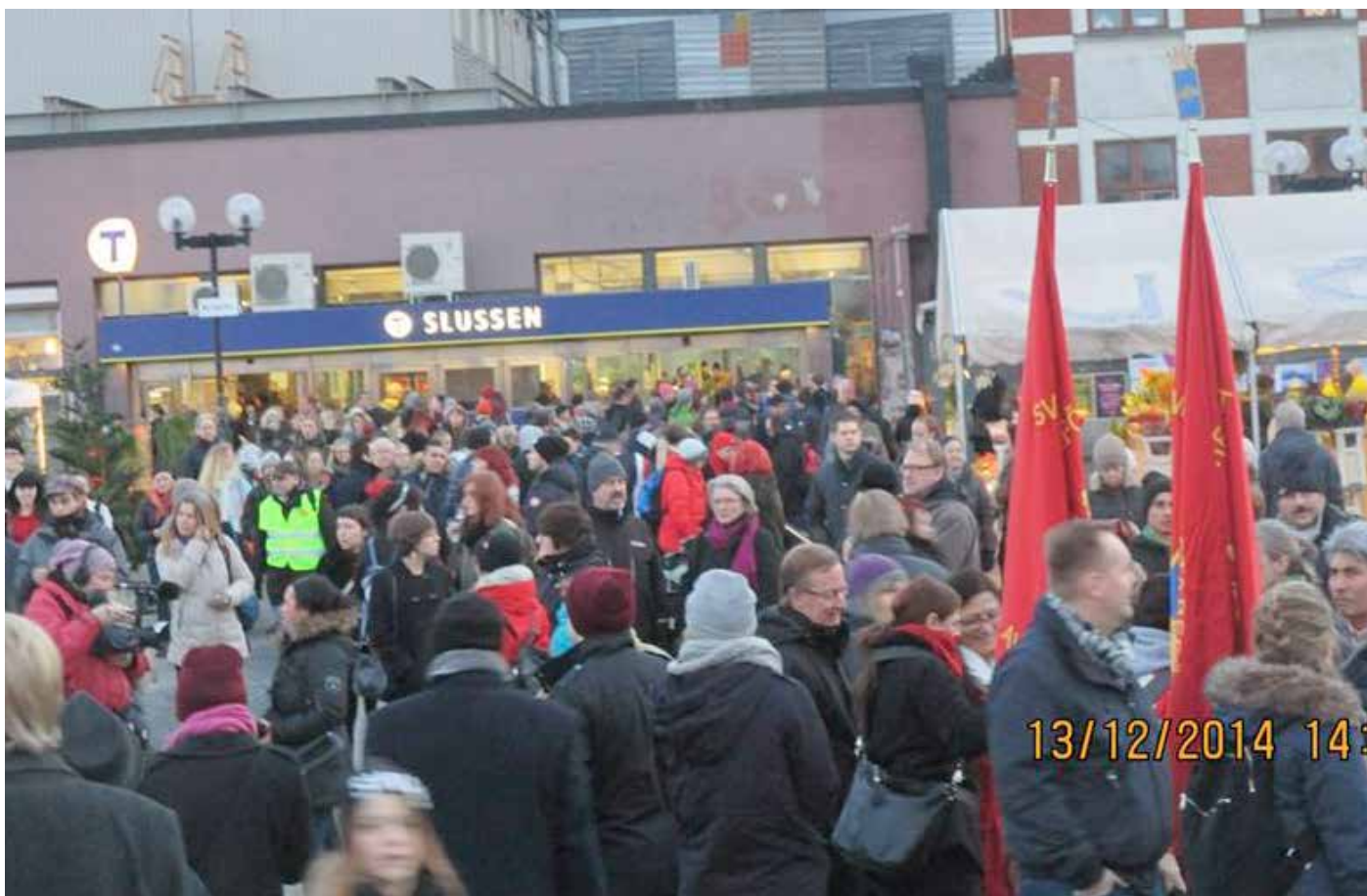
Demonstranterna samlas vid Slussen