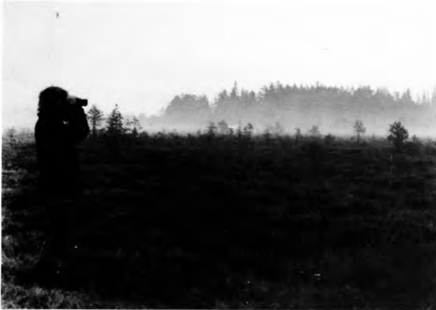
Björn B. en tidig morgon.